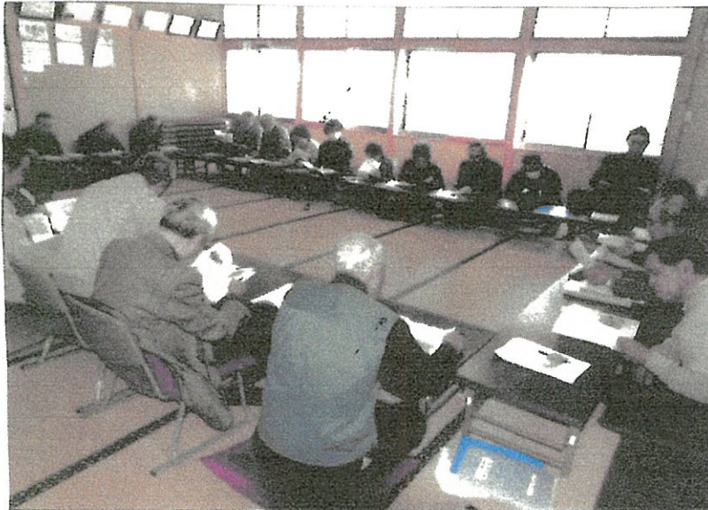
地域関係団体等説明会