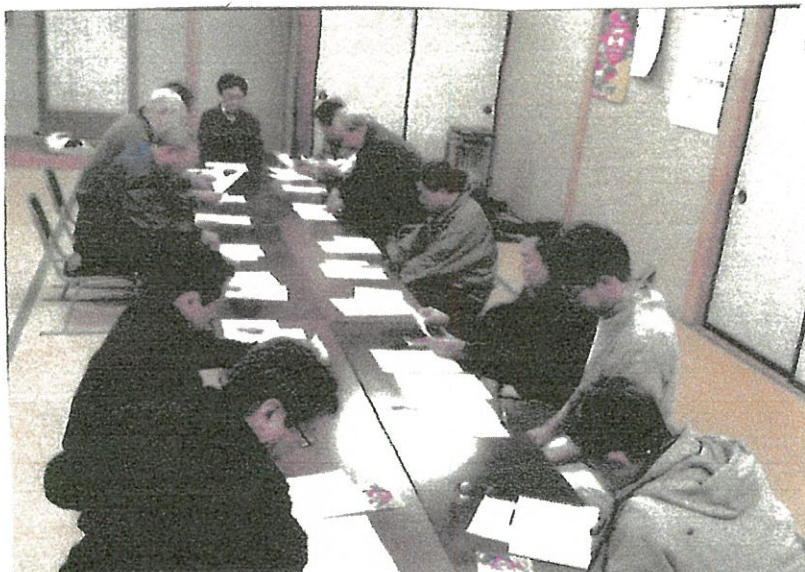
育成会役員との打ち合わせ会