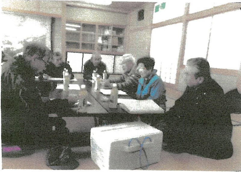
プロジェクト編集会議