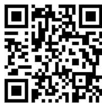
長野市消防局 HP QR コード

ホームページアドレス： https://www.city.nagano.nagano.jp/shobo/index.html