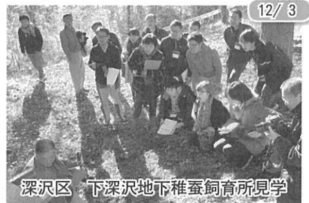
12/3 深沢区 下深沢地下稚蚕飼育所見学