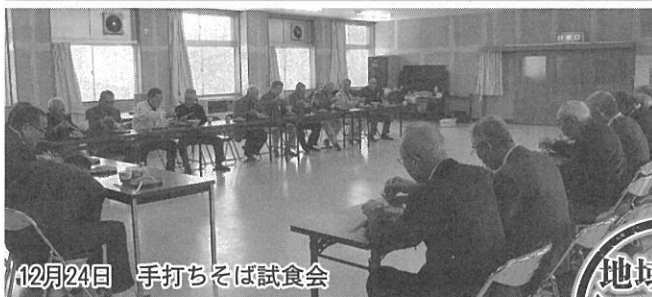
12月24日 手打ちそば試食会