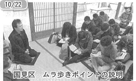
10/22 国見区 ムラ歩きポイントの説明

まず、10月22～23日の2日間に渡る合宿講座からスタート。国・県・市・地区の各行政体から課題と取組について事例紹介。そして国見集落に入り、5つのテーマごとに集落を観察し、大きな解地地図を錬成センターで一晩かけて作成。修生も駆けつけ夜更けまで討論会にも。続く11月5日には、小野平・日方・麻庭・吉窪の4集落へ班ごとに出向き、「聞き・描き」を実施。この地に伝わる無形の伝承をヒアリングして紙芝居に仕立て上げ発表。昼食には、ぶっこみ・おはぎ等の郷土食をたらふく頂戴しました。11月19日には、久保集落の全民家を穴があくほど観察し、民家の構成や規模を自らの身体で測り、立体模型で表現する講座を実施。最終的に下宮野尾公民館の天井から集落の全民家の白模型が吊るされた姿は圧巻でした。そして晩秋の12月3日は、深沢区にて神様と米づくりの講座。地元先生に教わりしめ縄づくりと、深沢区の4集落（上深沢・平深沢・下深沢・平林）を実際に見て歩きヤマ・ノラ・ムラそれぞれで多様な神様に出会いました。2月18日には、本学工学部にて小田切地区に向けた事業提案の発表会をグループごとに行います。