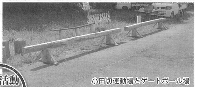
小田切運動場とゲートボール場