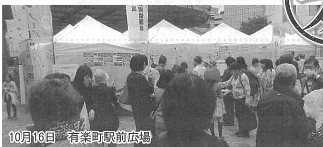
10月16日 有楽町駅前広場