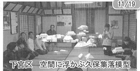
11/19 下宮区 空間に浮かぶ久保集落模型