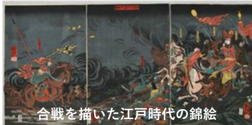
合戦を描いた江戸時代の錦絵