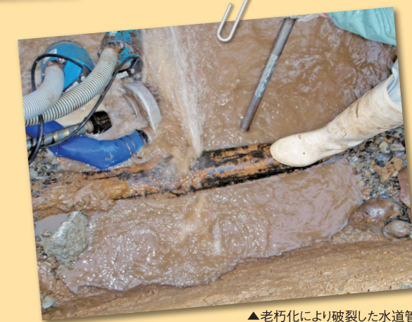
▲老朽化により破裂した水道管