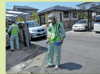
▲熊本市での支援活動(漏水調査)

平成28年熊本地震では、長野市からも職員5名と災害時の応援協定を結んでいる長野市水道工事協同組合の組合員5名を派遣し、漏水調査、漏水修繕の支援活動を行いました。