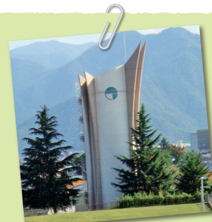
▲長野運動公園緊急貯水槽

長野市では基幹配水池や緊急貯水槽などにより、全市民の一週間分の水道水(一人当たり約90ℓ)を確保することができます。