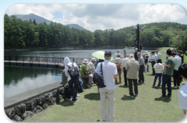
水道施設見学(戸隠水源)