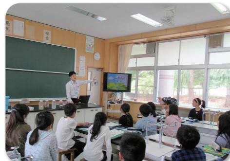
小学校での出前教室

※このほかに、市内の小中学校4年生を対象に、実験等を交えた授業を行う出前教室も行っています(学校単位での申込制)。