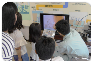
小学校自由研究お助け教室