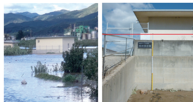
被災した豊野西沖浄水場 ※赤線は浸水ライン

浸水による被害や配水管・導水管の破損、断水等が発生しましたが、応急対応によって被害を最小限に抑えることができました。