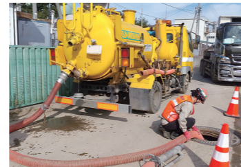
吸引車によりマンホールから吸水