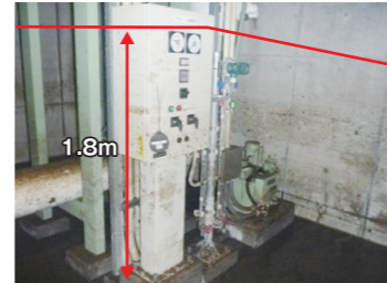
微生物タンク風量調整盤