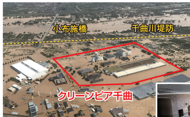
クリーンピア千曲

また、若槻、浅川団地ほか、一部のエリアからクリーンピア千曲に流入する汚水を、東部浄化センターへ流れるよう切替工事を行いました。