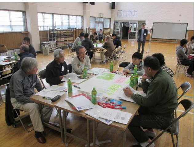
熱く語り合う各グループ