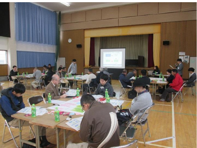
公共施設マネジメント推進課からの説明