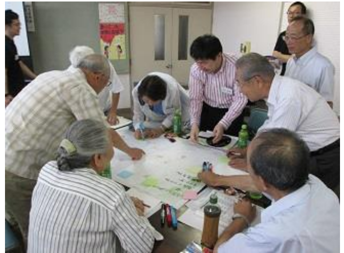
なごやかな雰囲気の中、様々な意見が出されました