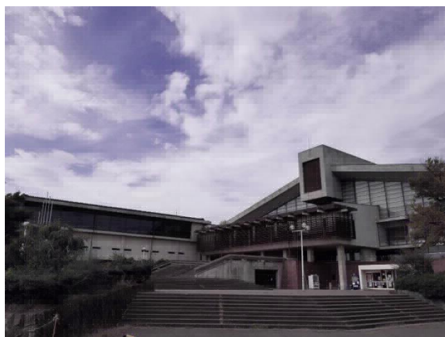
前回の「やまびこ国体」で建設された長野運動公園総合運動場総合体育館 (昭和 53(1978)年竣工)

社会体育館等は、市街地の体育館を中心に高い利用率となっており、特に夜間と土・日・祝日の予約が取れない傾向があります。また、避難所や投票所に指定されている施設があります。