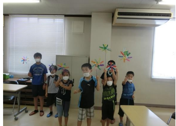
ペットボトルで風車をつくりました！