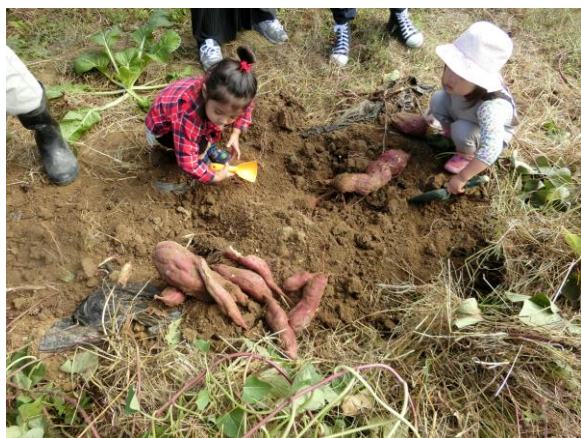
サツマイモ掘り体験