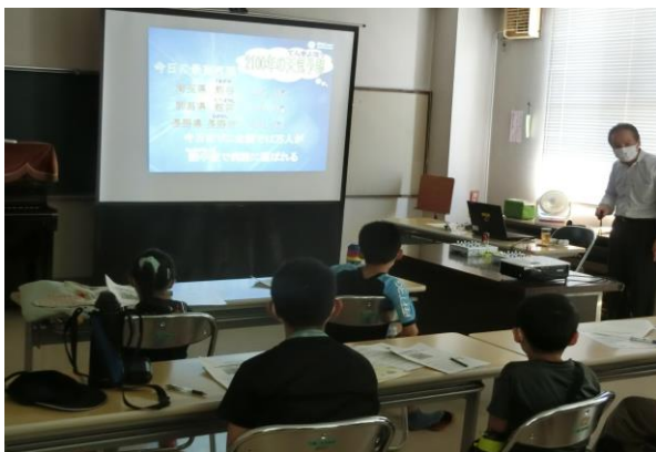
地球は熱中症なの？～講義風景～