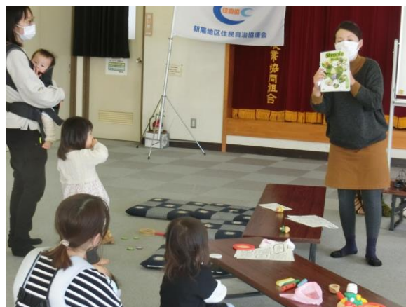
どうなってるの？子どもの英語教室