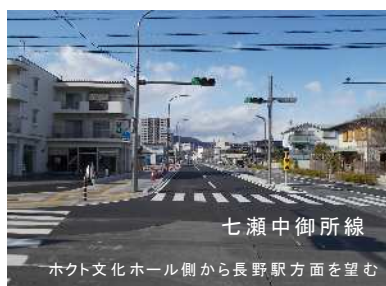
七瀬中御所線 ホクト文化ホール側から長野駅方面を望む