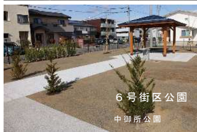
6号街区公園 中御所公園