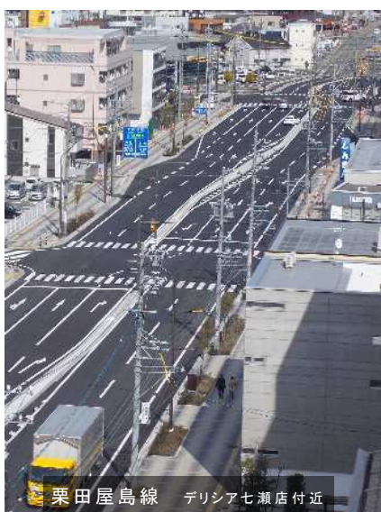
栗田屋島線 デリシア七瀬店付近

生活道路である区画道路も最後の整備が完了し、中御所地区に計画されていた6号街区公園もこの春完成しました。地元の皆様に中御所公園という名前をつけていただき、公園愛護会も設立され、皆様に愛される公園としてご利用いただきたいと思います。