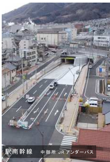
駅南幹線 中御所 JR アンダーパス

北側に新たな2車線を拡幅し、歩道の整備と車道・歩道への融雪施設、道路照明などを施工し、4車線化と両側に整備された歩道により、安全性の向上と円滑な通行が確保されました。