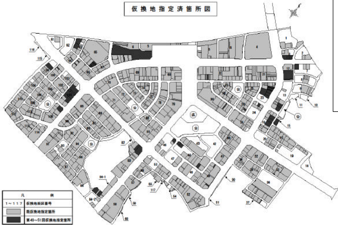
仮換地指定済箇所図