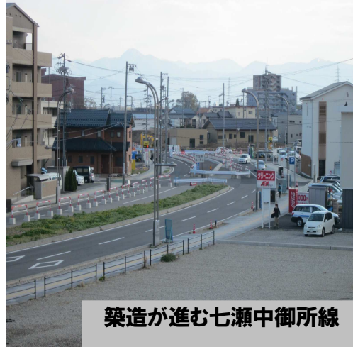
築造が進む七瀬中御所線