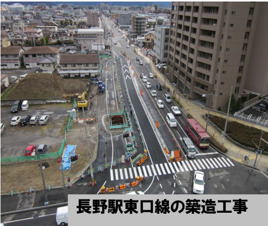
長野駅東口線の築造工事

また、平成二四年度末の仮換地指定率は、おかげ様をもちまして八六%超となりました。