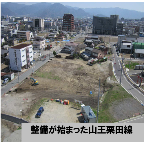
整備が始まった山王栗田線

いうまでもなく、土地区画整理事業は施行地区内の土地所有者ならびにその他の権利者のご理解とご協力がなければ事業の進捗を見ることはできません。関係する皆様からこれまでに賜りましたご協力に深く感謝を申し上げますとともに、今後ともなお一層のご支援を賜りますようお願い申し上げます。ごあいさつとさせていただきます。