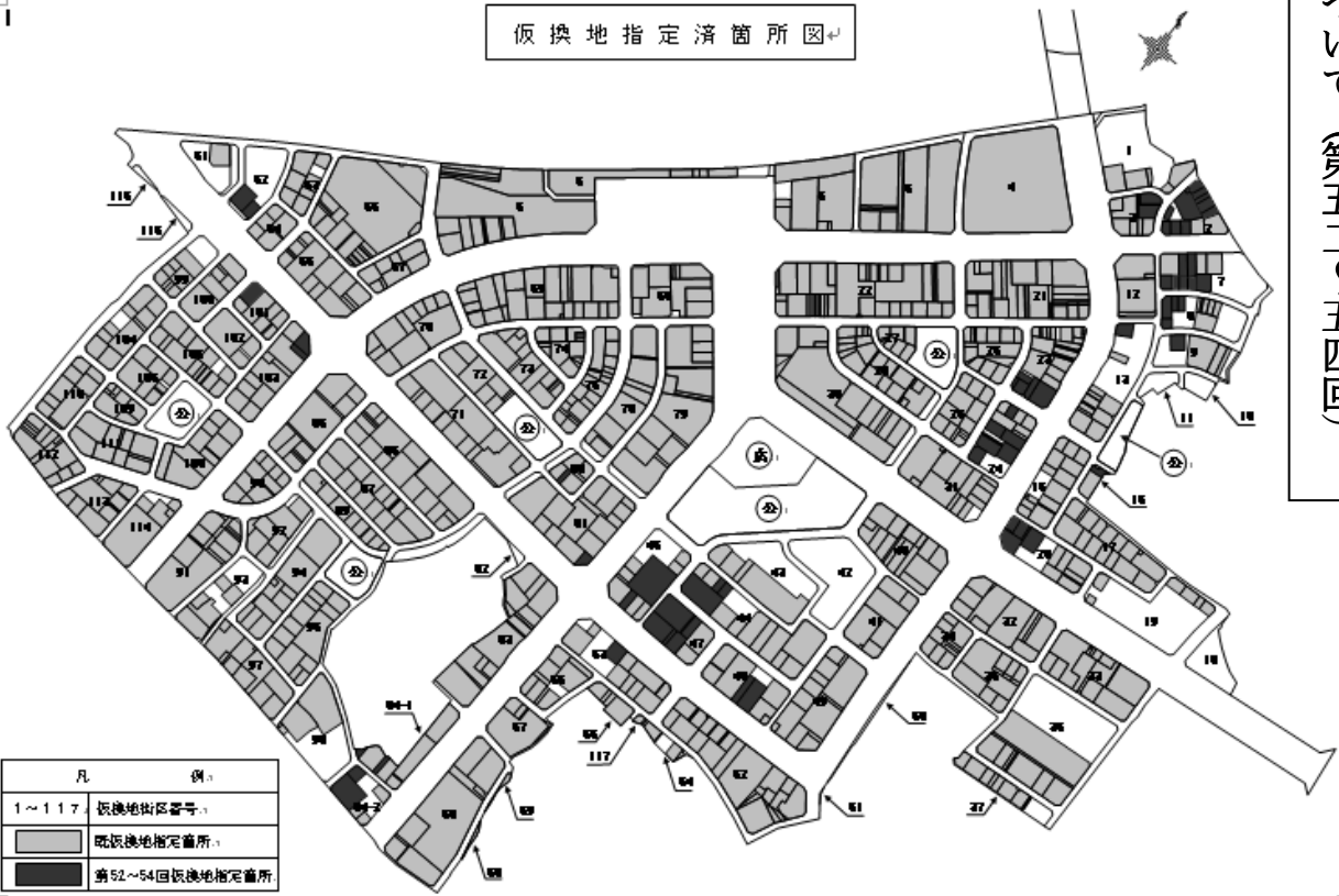
仮換地指定済箇所図