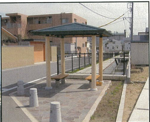
ポケットパークできました。