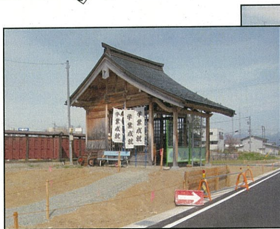
もうすぐ移転します。(中御所天満宮)

街づくりだより「ひがしぐち」は事業関係者に配布しています。配布漏れ等ございましたらお知らせください。