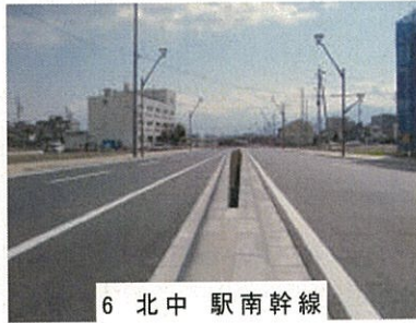
6 北中 駅南幹線