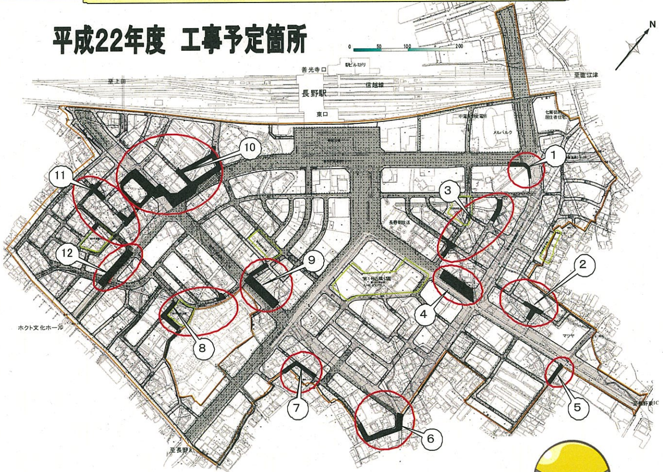
平成22年度施工予定箇所