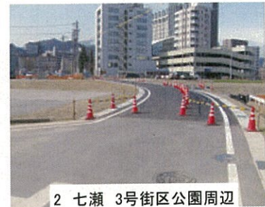
2 七瀬 3号街区公園周辺