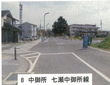
8 中御所 七瀬中御所線