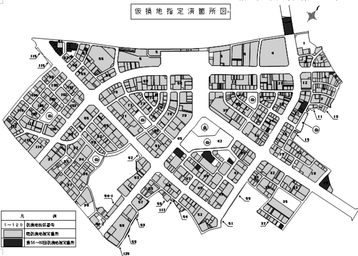
仮換地指定済箇所図