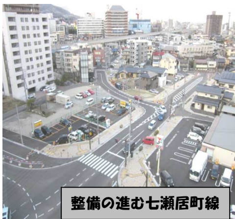
整備が進む七瀬居町線