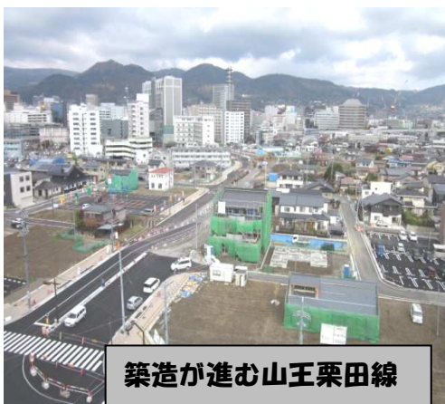
築造が進む山王栗田線

今年度から駅周辺整備局で再びお世話になることになりましたのも何かのご縁であり、職員一同が皆様のパワーの一部となって、完成に向けて取り組んでまいりますので、一層のご支援をよろしくお願いたします。