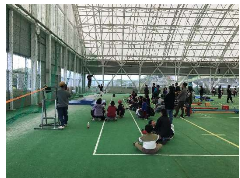
NAGANOスポーツフェスティバルでの スラックライン体験会 (長野市総合型地域スポーツクラブ北部連合)