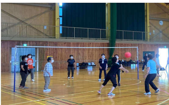
NAGANO健康スポーツ教室 「若返り体操・多種目スポーツ」 (塩崎スポーツクラブ)