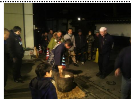
長野灯明まつり餅つき