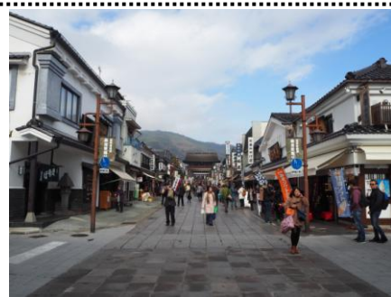
商店会から山門を眺める

現在も、参拝観光客へのサービスを主とする業種が中心となって商店街が形成されています。