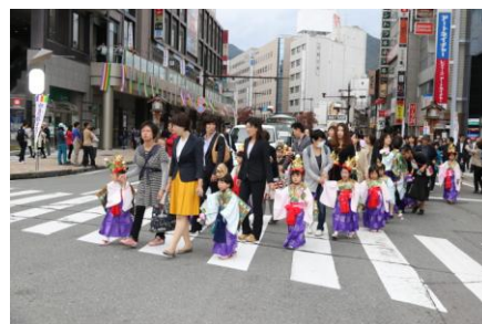
如是姫まつりの稚児行列

毎年10月に町内の長野駅前広場に建立されている如是姫像の顕彰式典は善光寺御住職をお迎えして行われます。また、子供の健やかな成長を願う稚児行列、ジャズ演奏、地元サッカーチームのサイン会などのイベント、まつりと同時開催の如是姫まつりセールや抽選会などを実施します。