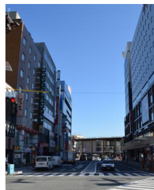
末広町交差点から長野駅を見る