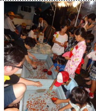
四万八千日観世音縁日大売り出し

・四万八千日観世音縁日大売り出し（於 観音寺） （8月9日 金魚すくい、すいか・モロコシ大売り出し、 ガチャ、野菜トラック市、地口燈籠協力）