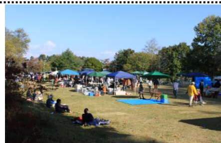
フリーマーケット