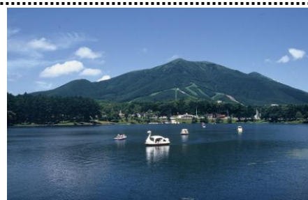
大座法師池と飯縄山