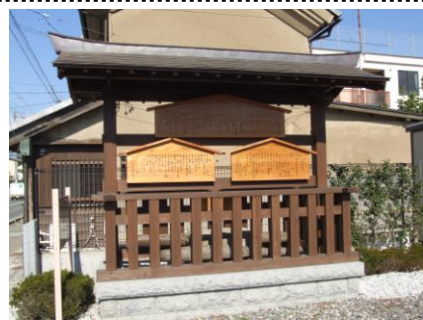
中町公民館の高札場

商店街の中心にある公民館には高札場（松代藩が城下に対する立札）が復元されている。