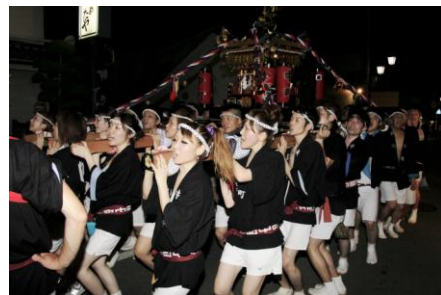
松代祇園祭中町みこし