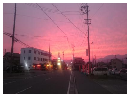
商店会から見た夕焼け