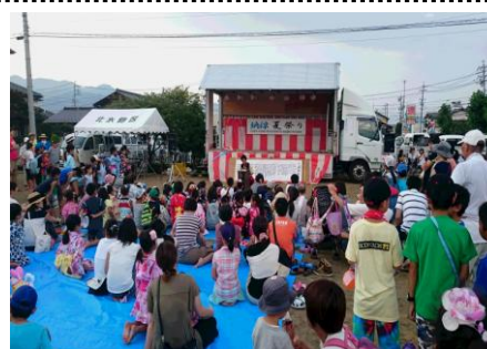
ひがの納涼夏祭り

8月上旬に地域内公園にて住民の皆様主催の「ひがの納涼夏祭り」に出店し、設営や運営の協力もしております。