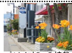
パルセイロカラーの植栽