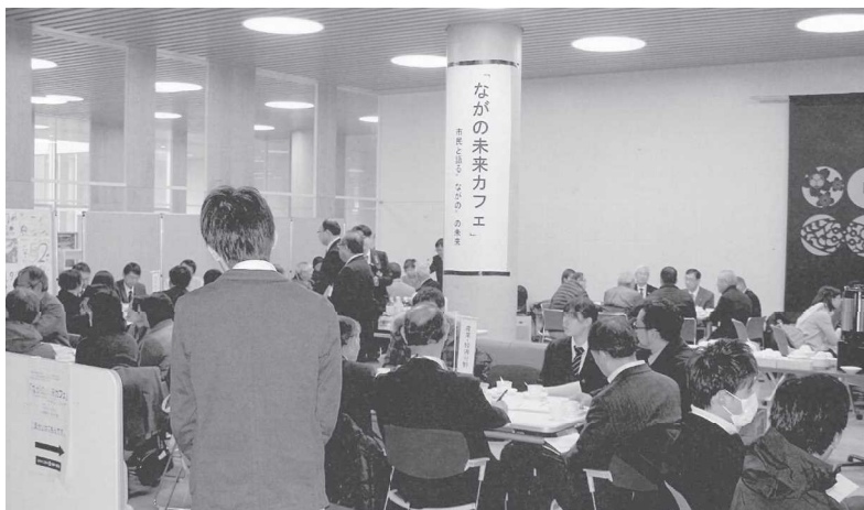
ながの未来カフェの様子