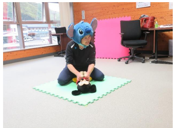
↓参加側から見た講師の先生