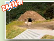
244号墳 大室古墳群で一番大きいよ