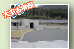
大室古墳館 大室古墳群のことが何でもわかるよ