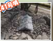
241号墳 合掌形石室を復元したよ