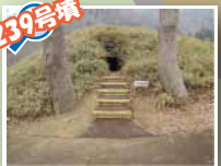
239号墳 石室の壁に何か書いてあるよ