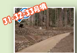
31・32・33号墳 石垣の中に古墳が埋まっているよ