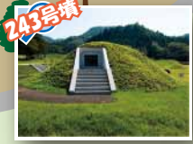
243号墳 盗掘坑から石室をのぞいてみよう！