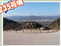
235号墳 石室の裏側がまる見えだね！ 景色も最高だよ