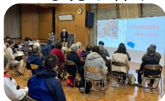
幻燈師による幻燈会