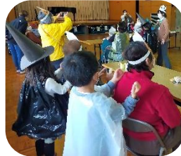
肩たたきをしてもらったり、歌を聞いて楽しみました。