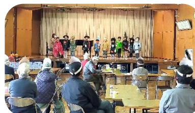
肩たたきをしてもらったり、歌を聞いて楽しみました。

誰でも参加ができる「おれん家カフェ」は、送迎も可能です。詳しくは事務局までお問合せ下さい。