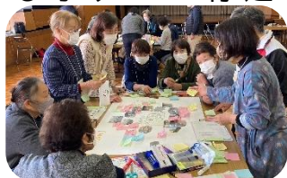
いっぱい発見・発展

した。その後のワークショップでは発見や課題として発展などを模造紙にまとめ、発表が行われ、最後には「こそ縁側」とまとめがされ、参加者には縁側ナビゲーターとして修了缶バッジが渡されました。