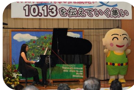
「ゆたかのまち」を皆で唄う