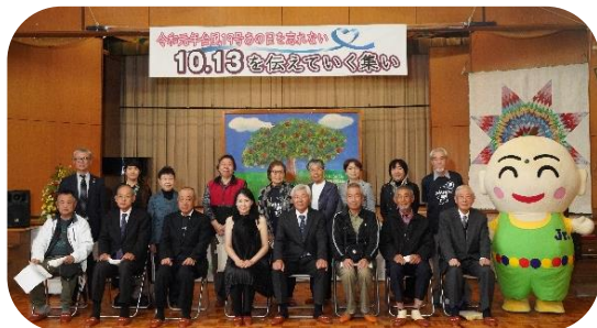
被災地区の方々と気持ち一つに祈念撮影

これからも災害を忘れず、この日を後世に伝えながら復興を地域一丸となり取り組んでいきたいと思えます。