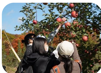
りんご取りを楽しむ参加者