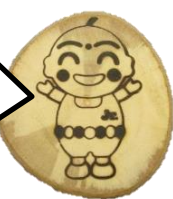
りんごの木マグネット