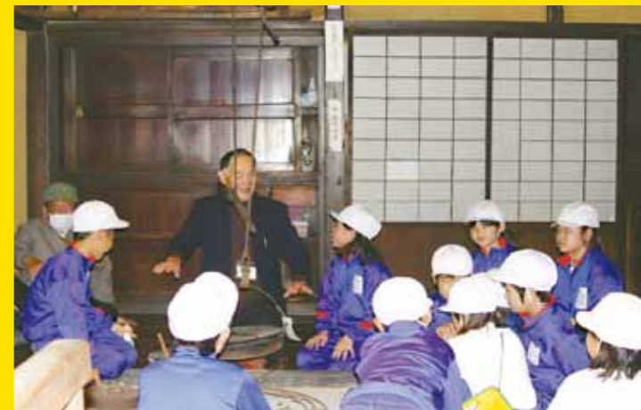
▲(例)古民家ガイド… 囲炉裏のお話