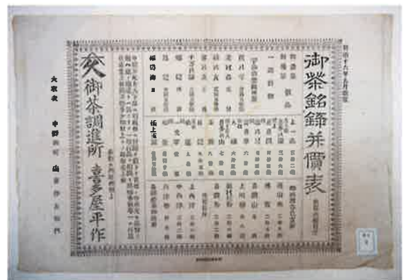
写真4 「御茶銘録并價表」明治16年9月（長野市公文書館蔵） この中に「昇龍」の銘柄がみられる