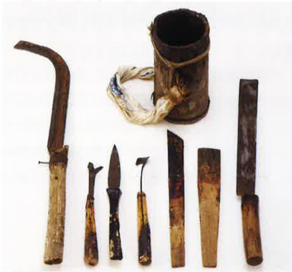
写真 13 漆掻き職人の道具(石川県輪島漆芸美術館蔵)