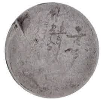
写真6 水がめの底に 壺号 五斗入 五寸入■■ 三寸■■ ■■■■

その後、調べてみると水がめをはじめとする石見焼の日用雑器は、当館だけでなく、白馬村や旧堀金村（安曇野市）、さらには軽井沢町の博物館にも展示・収蔵されていることがわかりました。