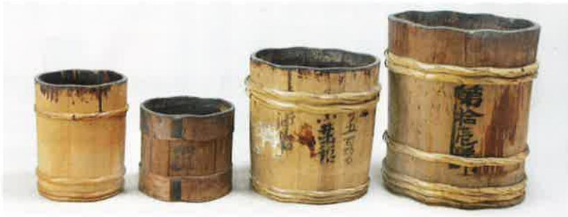
写真 12 漆入れ桶