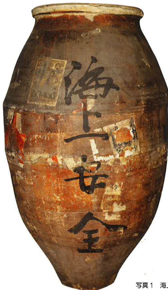
写真1 海上安全の文字が記された茶壺

収蔵資料展「道具が語る人の動き・物の流れ ～この茶壺はどこから来たの?～」展示資料紹介