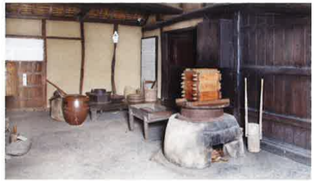
写真5 常設展古民家内

れていました。しかもその製造元は大正初年に地元に鉄道が敷かれる際に駅の用地となったため、廃業した所でした。そのため、この水がめは鉄道敷設以前、茶壺と同じように船によって日本海経由で長野に来たこととなります（写真6）（写真7）。