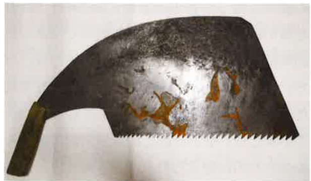
写真10 市内の下駄屋が使用した前挽き鋸