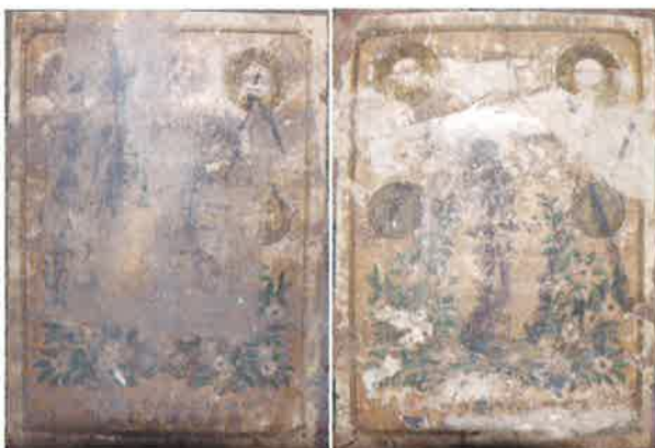
写真3 茶壺に貼られている商標