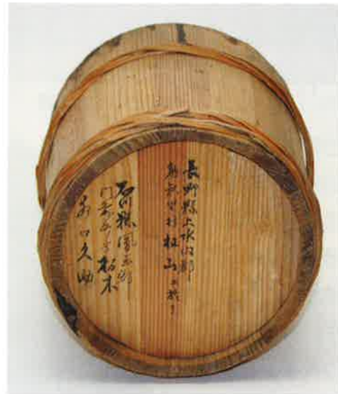
写真 14 漆入れ桶底面

までは国内産のものも使われていました。輪島周辺には漆を掻き取る職人がいて、漆の産地へ赴き、春から秋にかけて漆を掻きました。その主要産地が岩手や長野といった山間地帯だったのです。