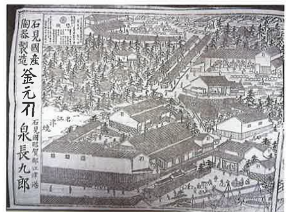
写真7 『石見国商工便覧』中谷與助 明治27年（島根大学附属図書館蔵）