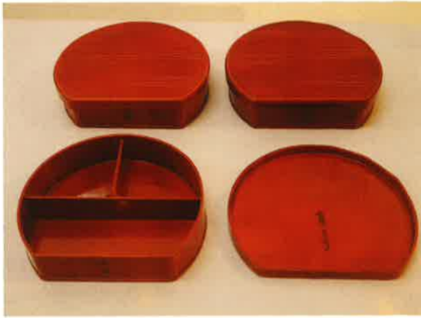
写真15 「耳より」と入った漆塗りの弁当箱

桶などの道具を置いていくのが常でした。しかし昭和30年代末頃から安価な輸入産の漆におされ漆掻きの仕事が廃れると、能登からの集団は来なくなり、預かった道具だけが物置に残されたのでした。