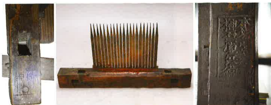
写真9 島根県産千歯扱き 「島根県 内榊原」 「本場製造所 榊原運兵衛」