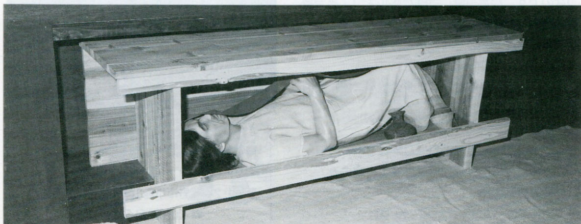
▲木棺の中に納められた遺体（復元）

今回展示した5号木棺墓には3体が埋葬され、骨の重なり具合や位置などから、同時に納められたと考えられます。この木棺は、組合せ式箱形木棺 こぐちいた といい、両端の小口板を墓穴の底面に深く立てて組合せたと考えられます。木棺の大きさは幅約50cm、長さ約150cmほどです。遺体は仰向けで下肢を曲げる姿勢で納められたようです。また遺体には赤色顔料(ベンガラ)が塗布されていました。