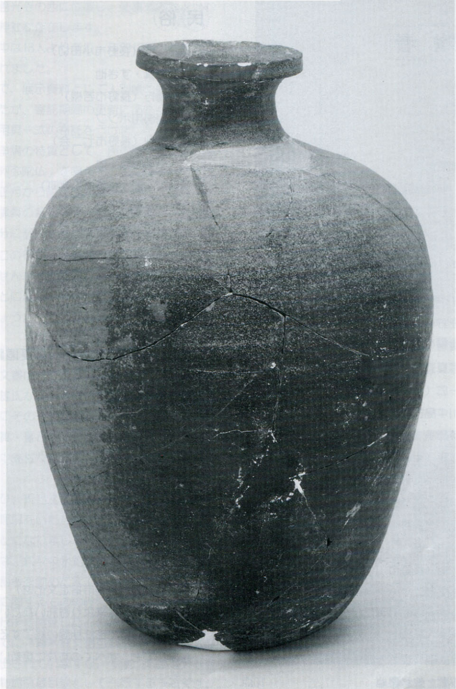
▲長原7号墳出土の壺（当館蔵）