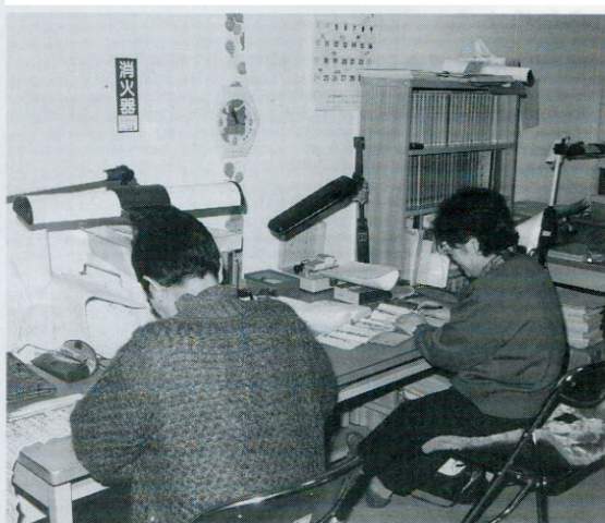
▲青木家文書の整理風景

現在までに『青木家文書目録』が東京教育大学によって出されていますが、今後、未整理分を含めて、博物館所蔵目録として刊行する予定です。