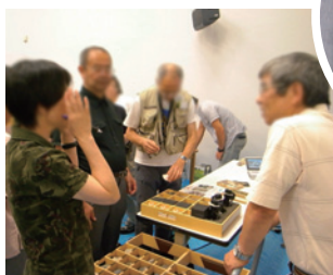
▲ ワークショップのようす