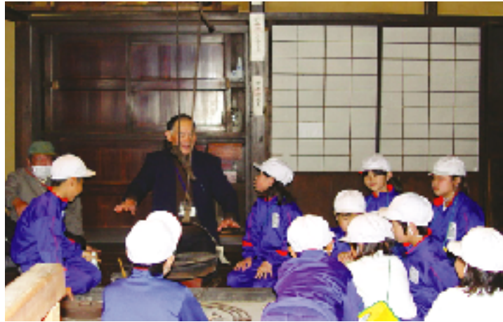
▲(例) 古民家ガイド… 囲炉裏のお話し