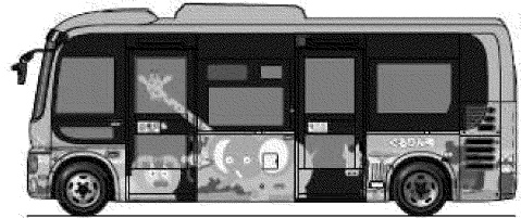
34人乗り(座席12、立席21、乗務員1)でノンステップ、車イス用スロープ完備。