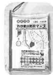
H31.1発行 豊野地区 わが家の防災マップ一