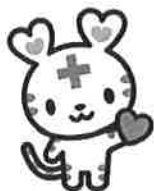
日本赤十字社 公式マスコットキャラクター 「ハートラちゃん」