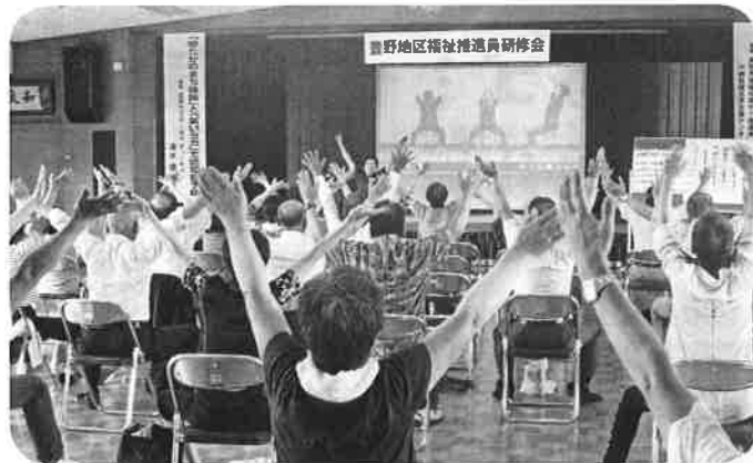
認知症予防の体操を楽しむ受講者