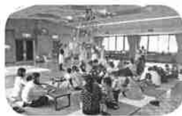
願いが届きますように

「おひめさまになりたい☆」短冊にたくさんさんの願いが飾られた七夕かざりができました。7月9日(火)「かがやきひろば豊野」で47名の親子が参加しました。 民生児童委員さんが用意した滑り台やボールプールなどで遊び、七夕かざりづくりを楽しんだ後は、食改さんが作ったおやつタイム♪みんなで楽しい時間を過ごしました。