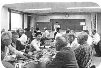
カードゲームで盛り上がる会場

最後に助合いカードゲームが参加者間で行われ、ゲームが進むうちに思わぬ人が意外な能力があるのが明らかになり、興味深い事でありました。盛況のうち研修会に終了した研修会になりました。