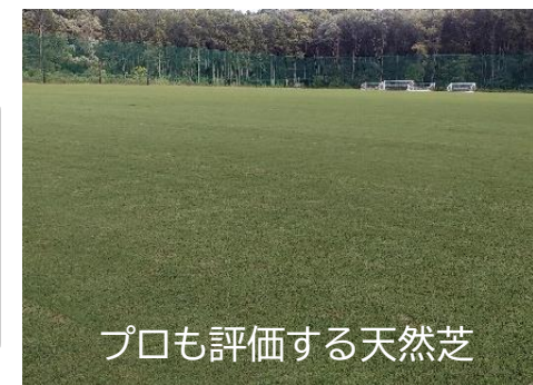
プロも評価する天然芝