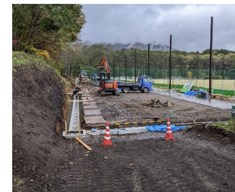
拡張工事中の駐車場