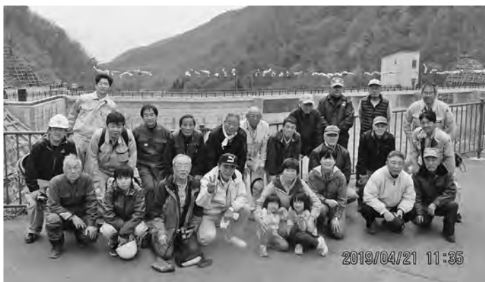
【協力してくれたみなさん】