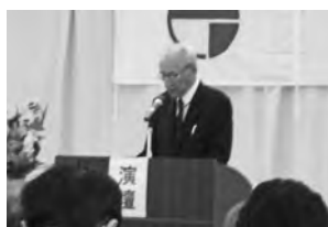
【山田住民自治協議会長のあいさつ】

4月20日(土)午後2時より浅川公民館大会議室にて、浅川地区住民自治協議会の定期総会が評議委員56名(内委任状8名)他105名の区民が出席し開催されました。