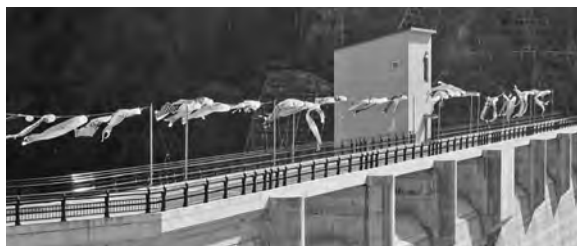
【気持ち良さそうに風に舞う鯉のぼり】

鯉のぼりが陽春の風をはらませて気持ち良さそうに泳ぐ姿に、作業の疲れも吹き飛んでゆくようでした。