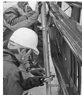
【掲揚方法に工夫をしました】

午前9時から始まった作業。昨年の掲揚の反省を踏まえてダムを流れる複雑な風でも絡まないように、掲揚方法に様々な工夫を加えた結果、比較的スムーズに掲揚ができ参加者一同今後の事業継続に自信を深めました。