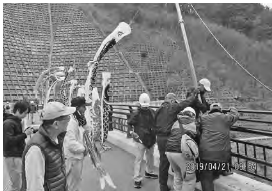
【力を合わせてポールを立てる！】

4月21日（日）ボランティアのみなさん、住自協役員、区長合わせて30名余が、地区内外から提供された鯉のぼり90匹余を浅川ダムの165mの天端に掲揚を行いました。この鯉のぼり掲揚は昨年引き続き2回目、「浅川地区まちづくり計画」の一環で、浅川改良事務所、浅川支所と合同で実施しました。