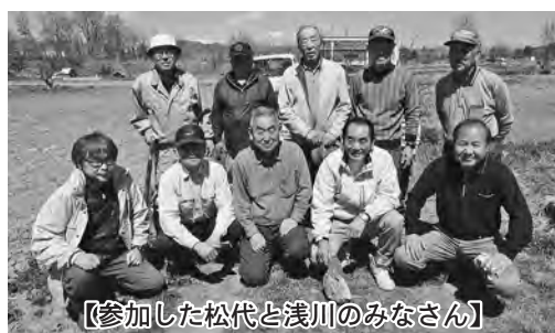
【参加した松代と浅川のみなさん】

浅川住自協では「浅川まちづくり計画」の一環として、6月に浅川ダム周辺の遊歩道沿いに植え付ける予定。エドヒガンザクラは順調にいけば定植から5～6年で花をつけるといいます。浅川ダム周辺ではハナモモの植樹、フジバカマや菜の花の植栽も行われておりこれからが楽しみです。