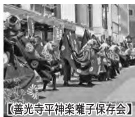
【善光寺平神楽囃子保存会】

浅川地区には今回参加した3団体のほかにも神楽保存団体がありますが、いずれも会員の高齢化や減少に伴って活動が困難となってきています。今回のような催しへの参加を糧に貴重な伝統文化として各地区における活動が持続されることを願っています。熱演されました皆さん、ご苦労様でした。