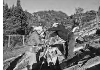
【河川敷ハナモモ植栽 （2018.10）】