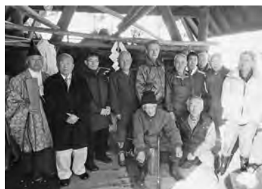
【火入れ式に集まった皆さん】