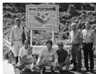
【浅川フジバカマ苑看板設置・ 飛来したアサギマダラ（2019.9）】