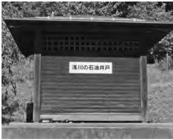
【石油井戸跡看板設置（2019.9）】