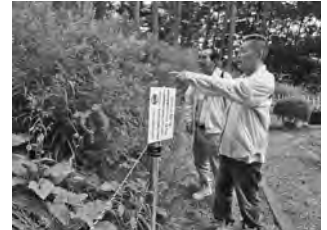
【長野市霊園ゴマシジミ パトロール（2018.8）】