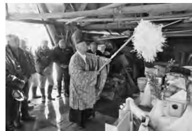
【火入れ式～作業の安全を祈願してお祝い～（1/6）】