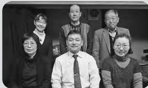
【広報委員のみなさん】

浅川の情報がいっぱい詰まった広報誌「せせらぎ」。住民自治協議会それぞれの団体が地域の為に協力し合い活動し、地域が創られていることを改めて感じうれしくなりました。