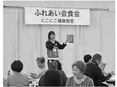
日本赤十字社の 活動紹介