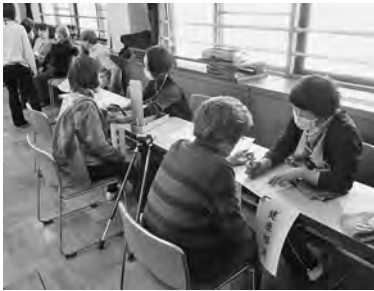
博愛の園・北部保健センター による健康チェック