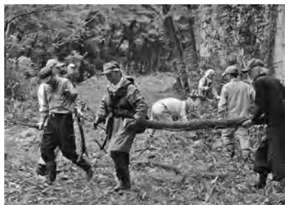
【浅川河川敷遊歩道整備（2016.9）】