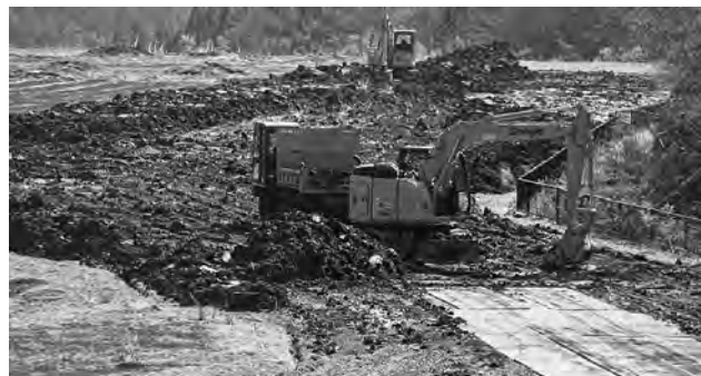
【次々に搬入される災害土は3,600㎡】