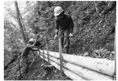
【秋場三尺坊参道整備（2019.7）】