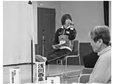
講師による健康講座 転倒予防体操