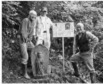
【十三仏整備・案内板設置（2019.9）】