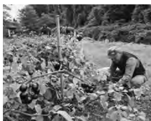
【河川敷でのハuckleベリー栽培と 商品化されたジャム（2018.11）】