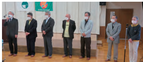
【新旧役員交代～(左)退任する役員さん、(右)新任の役員さん】