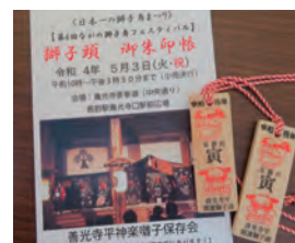
【御朱印 押印ラリーで “一万度魔除け 札”進呈】