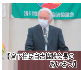
【宮下住民自治協議会長のあいさつ】

4月16日(土)午後2時より、浅川公民館大会議室において定期総会が開催され、常任評議委員を中心に52名が出席しました。新型コロナウイルス感染状況を考慮して、昨年、一昨年と書面表決が続きましたが、今回は2年ぶりに常任評議委員会による代行開催となりました。