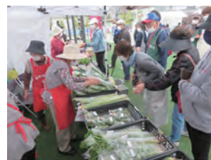
【住民自治協と坂中直売所はお隣同士～直売所は大人気でした！】