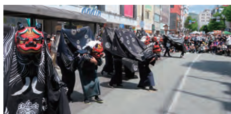
【オープニングは善光寺平 神楽獅子保存会の15頭の獅子舞】