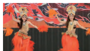
【ステージでは多彩な演奏や踊りが披露されました！】