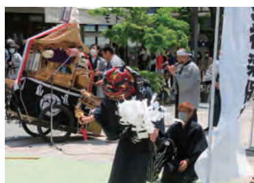
【伺去神楽保存会が舞いました。お疲れ様でした】