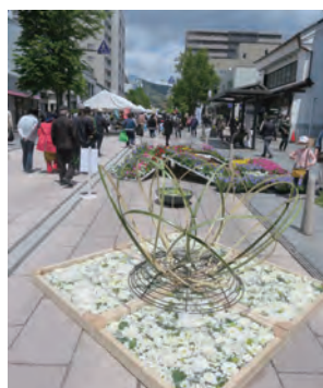
【善光寺花回廊も 華やかに！】

また同時に「善光寺花回廊」も開催され、ゴールデンウィーク後半初日の気持ちの良い青空のもと大勢の観客で賑わいました。