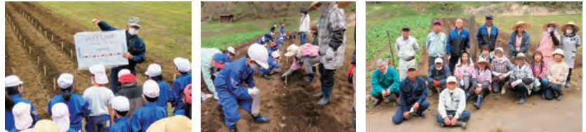
【“じゃがいも収穫体験”（左から）説明を受け⇒植付けてから 肥料をくれます⇒坂中地区のみなさん、ありがとう！】