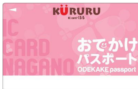
長野市おでかけパスポート