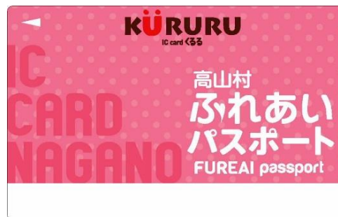
高山村ふれあいパスポート