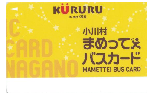
小川村まめってえバスカード