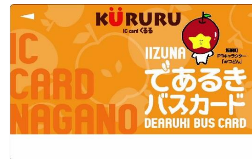
飯綱町IIZUNAであるきバスカード