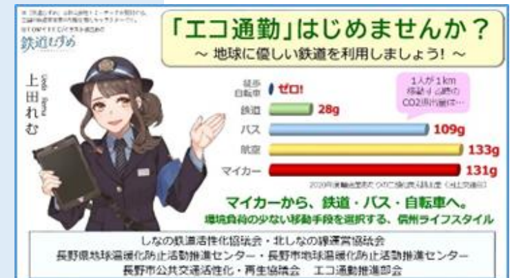
【しなの鉄道中吊り広告】