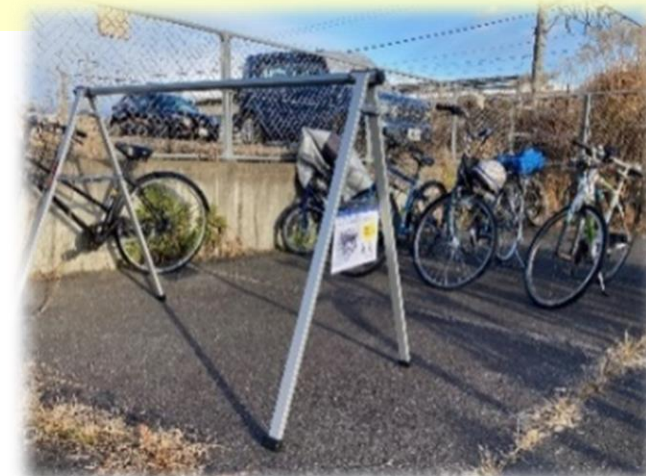
【サイクルスタンド設置】 (三才駅自転車駐車場)