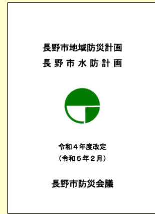
【令和4年度改定 長野市地域防災計画】