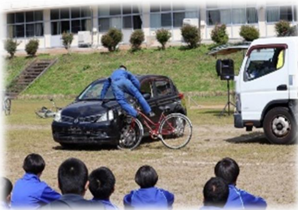
【世代に応じた交通安全教室の実施】 (スケアード・ストレート方式の交通安全教室)