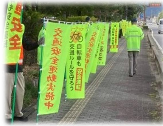
【安全な自転車利用につながる広報活動の実施】 (街頭啓発活動)