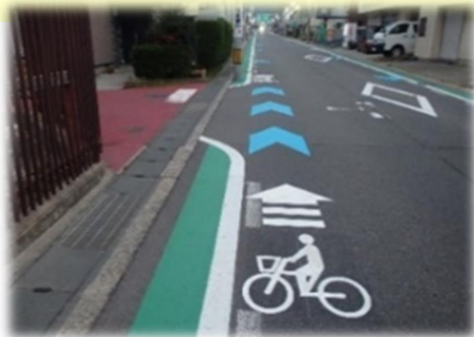
【矢羽根型路面標示】 (三輪幹線)