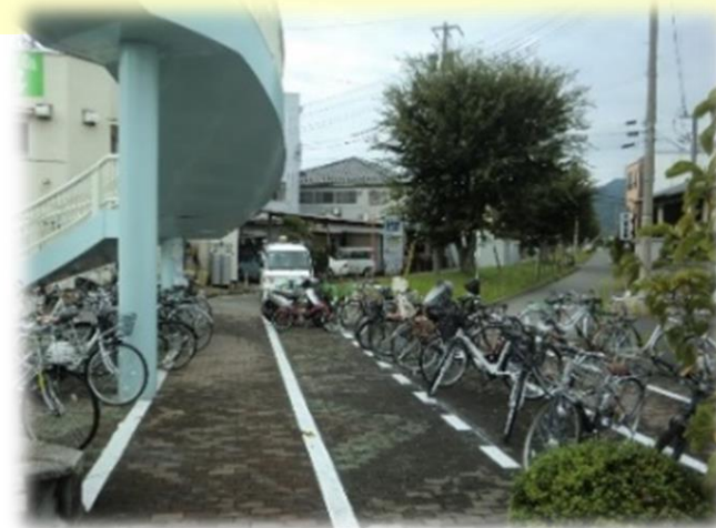
【バス停周辺駐輪場区画線の整備】 (丹波島橋南自転車駐車場)