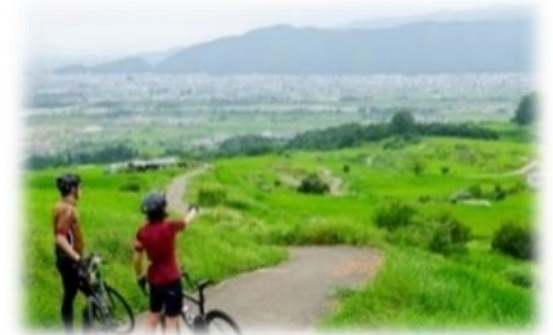
【「NAGANO CYCLING」より】 (モデルコース実走レポート)