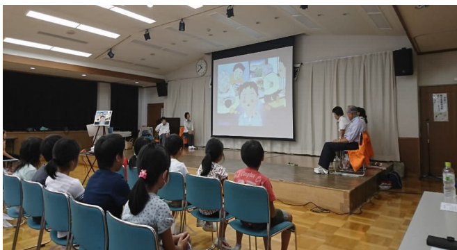
【浅川小学校】4年生・地区住民