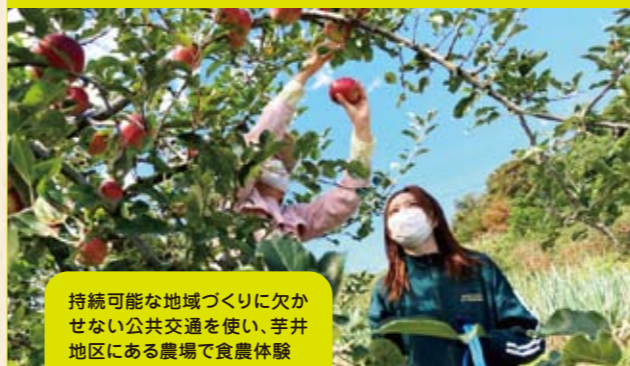
持続可能な地域づくりに欠かせない公共交通を使い、芋井地区にある農場で食農体験

参加者の声 地域の課題を考えるきっかけになった。また、活動中は子どもたちが大人と一緒に農業を楽しむ姿が見られ、とても嬉しかった。このような農業を通じた輪が広がってほしいと思った。