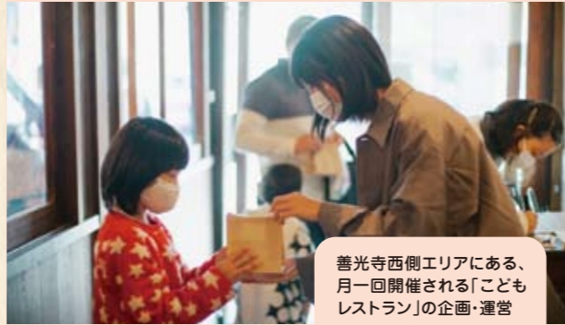
善光寺西側エリアにある、月一回開催される「こどもレストラン」の企画・運営

参加者の声 外に出て、活動することで前より自分に自信がいた気がする! いろんな人とのつながりができて本当によかった