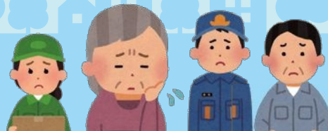
地域の人・身近な大人