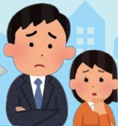
学校の先生・福祉の人