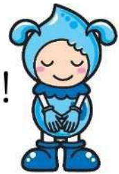
長野市上下水道局 イメージキャラクター 「みすなちゃん」