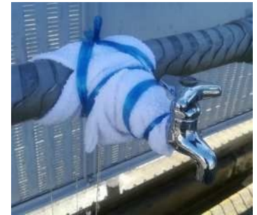
② 破裂箇所の止水の例