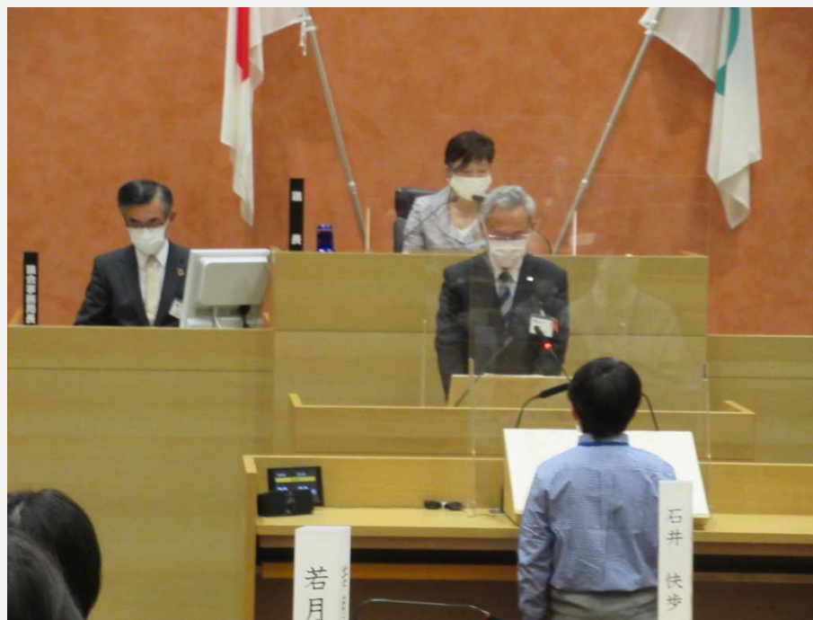
子ども議会の様子（令和4年3月25日）