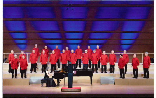
(ゴールデンボーイズ：80歳以上の元気な姿)