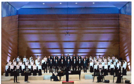
(コールハレルヤ：ゲスト出演者との共演)