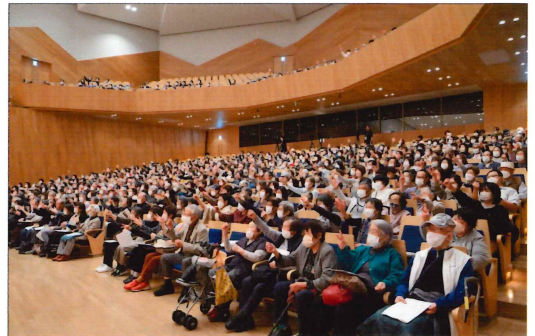
(長野市身体障害者福祉協会会員の皆様もご一緒に手遊びを楽しんでおられました)