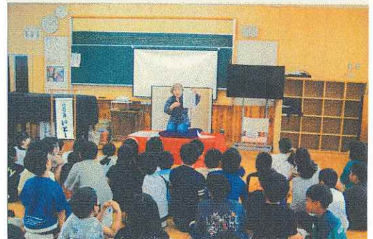
7月26日 出前寄席(朝陽子どもプラザ)