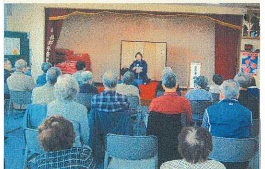
11月18日 出前寄席(中御所公民館)