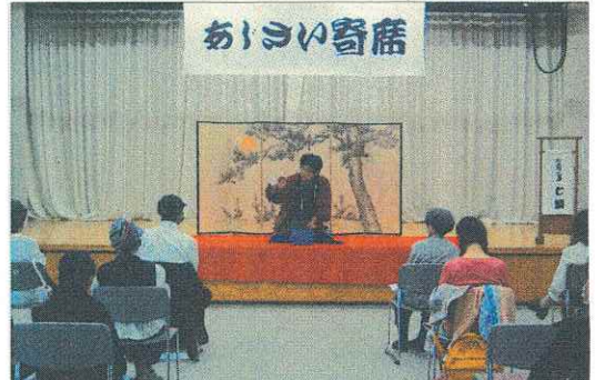
6月11日 あじさい寄席(ふれあい福祉センター)