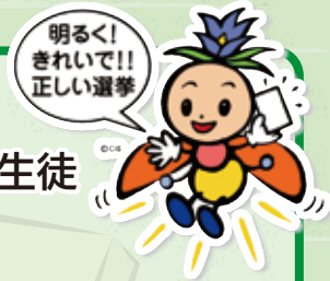
長野県選挙啓発 マスコットキャラクター 「ほたりちゃん」